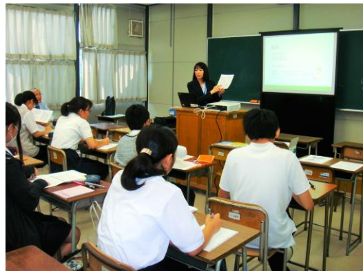
母校での弁理士による キャリア教育