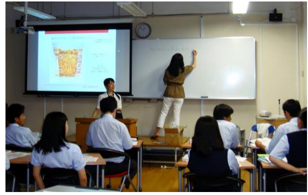
世界初カップ麺の発明秘話とは？