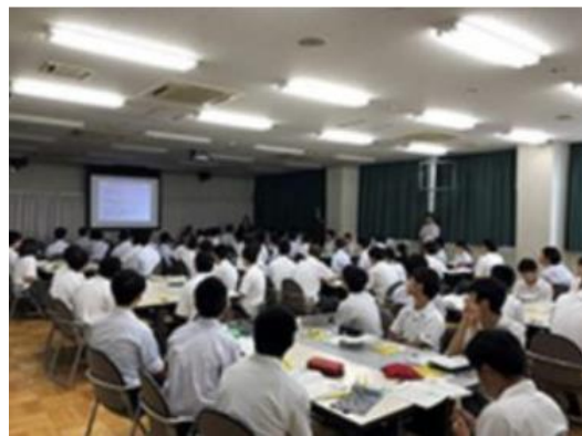
知的財産の基礎知識の説明